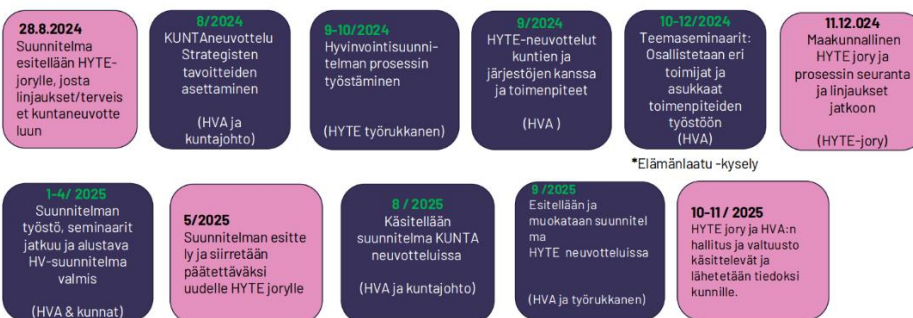
Kuva 1. Alustava laajan hyvinvointisuunnitelman suunnitteluprosessi vuosille 2024-2025